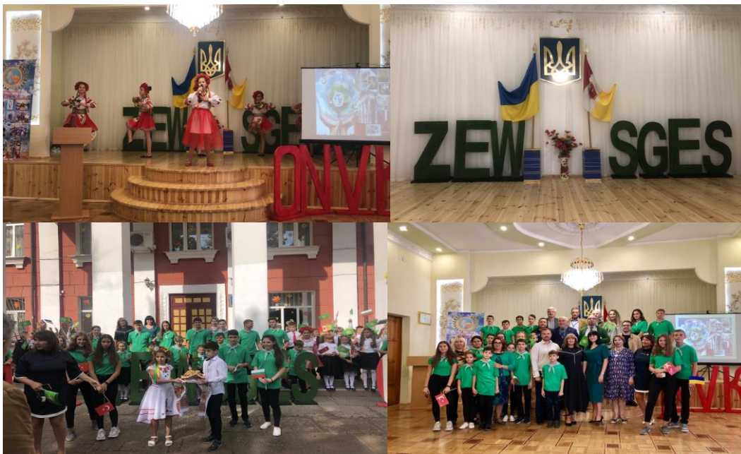
Малюнок 5. Фотографії, зроблені під час навчання ЕЕР в школах Одеси (Україна)