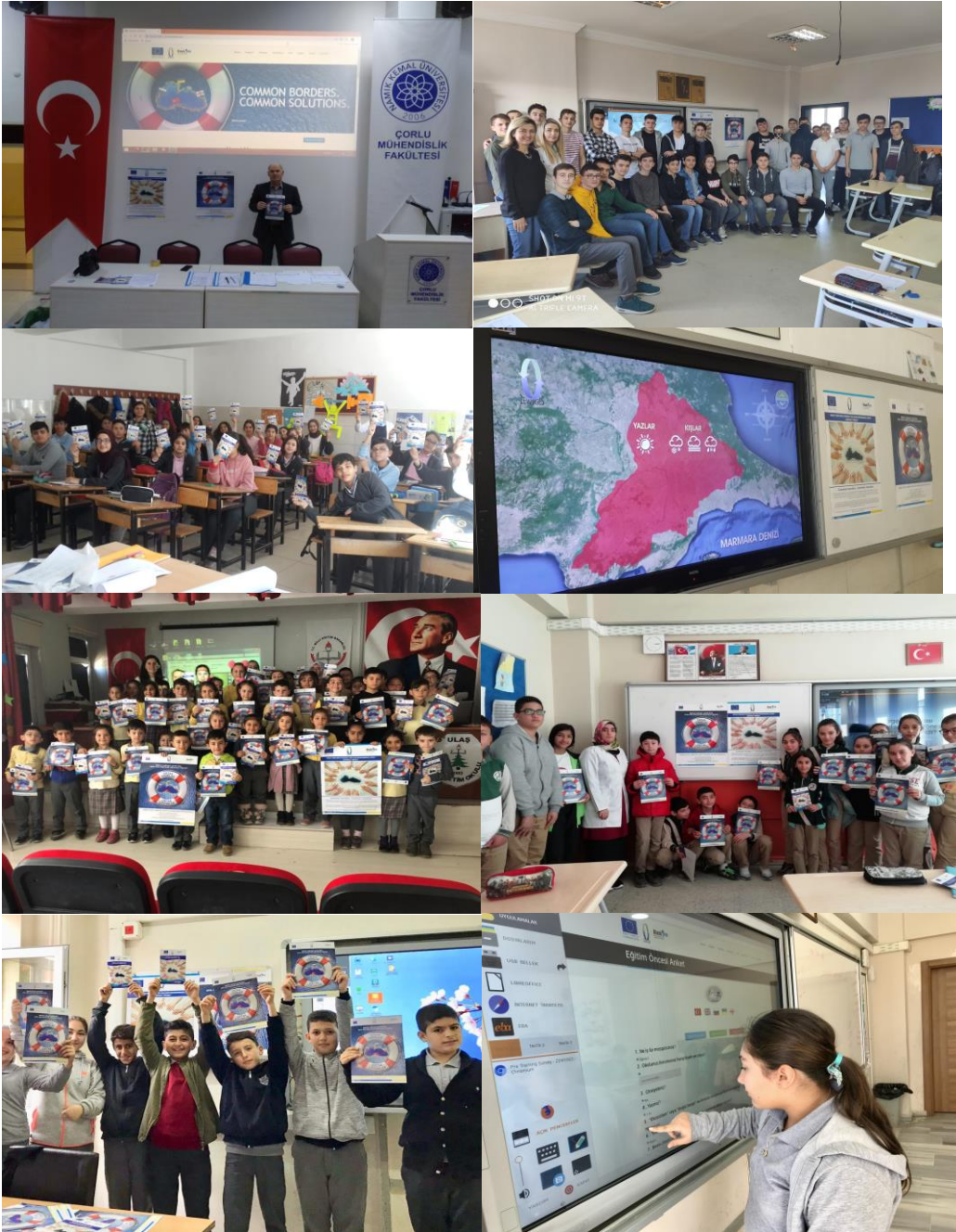
Малюнок 3. Фотографії, зроблені під час навчання ЕЕР в школах Текірдагу (Туреччина).

Цей проект фінансується за рахунок 1-й конкурсу пропозицій спільною оперативною програмою «БАСЕЙН ЧОРНОГО МОРЯ» 2014-2020