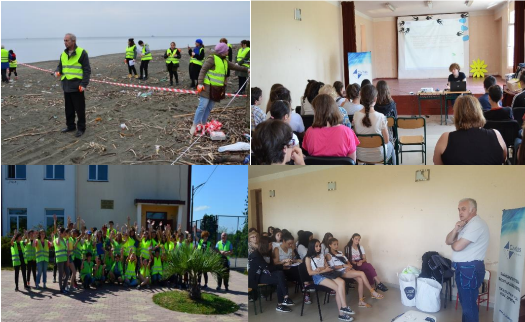
Малюнок 6. Фотографії, зроблені під час тренінгу ЕЕР в школах регіону Гурія (Грузія)

Цей проект фінансується за рахунок 1-й конкурсу пропозицій спільною оперативною програмою «БАСЕЙН ЧОРНОГО МОРЯ» 2014-2020