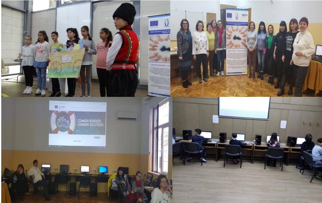
Малюнок 4. Фотографії, зроблені під час навчання ЕЕР в школах в Бургас (Болгарія)

Цей проект фінансується за рахунок 1-й конкурсу пропозицій спільною оперативною програмою «БАСЕЙН ЧОРНОГО МОРЯ» 2014-2020