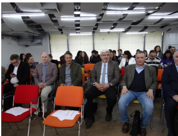
Малюнок 2. Конференція в Бургасі-Болгарія 14-15 травня 2019 року.