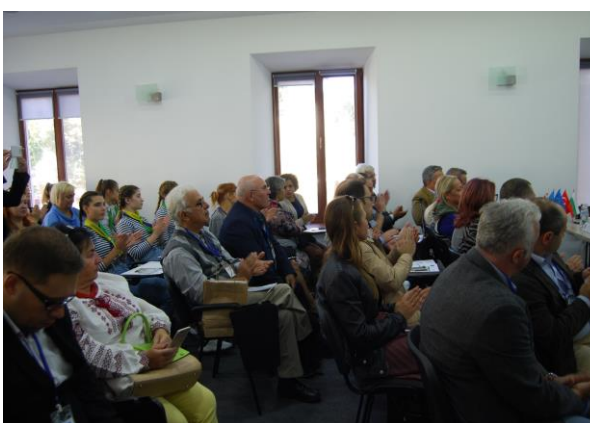
Малюнок 3. Конференція в Одесі (Україна) 19-20 вересня 2019.