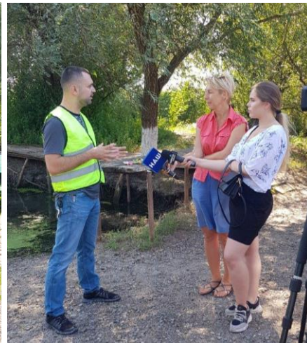
Рисунок 4. Анція риболовлі на сміття, проведена UKRMEPA в Одесі, УКРАЇНА, в серпні 2020 року.

Болгарія (TDCNM), Україна (UKRMEPA) та Грузія (CIVITAS Georgica) проводили очистку пляжу за участю 255, 280 та 63 осіб, тоді як Туреччина (TNKU) проведе в жовтні 2020 року.